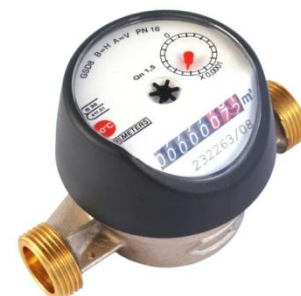
SPONSOR ŻŁOTY BMETERS POLSKA Sp. z o. o.