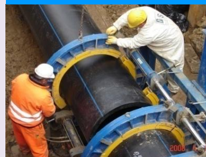
SPONSOR ŻŁOTY KWH PIPE POLAND Sp. z o.o.