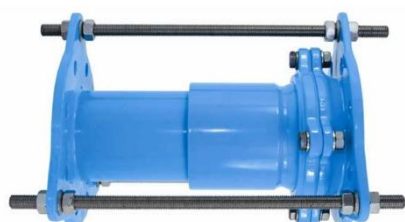
SPONSOR SREBRNY FABRYKA ARMATURY HAWLE Sp. z o.o.

Konferencja i wystawa zorganizowane będą w Hotelu Kongresowym – Centrum Biznesu w Kielcach, Al. Solidarności 34, 25-323 Kielce www.hotelkongresowy.pl