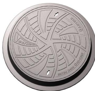
SPONSOR SREBRNY ODLEWNIA ŻELIWA FANSULD Sp. j.