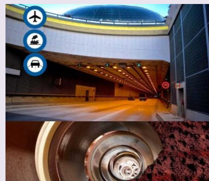
SPONSOR PLATYNOWY KERAMO STEINZEUG N.V. Oddział w Polsce