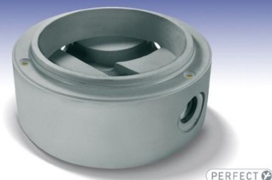
SPONSOR ŻŁOTY ZPB KACZMAREK Sp. z o.o.